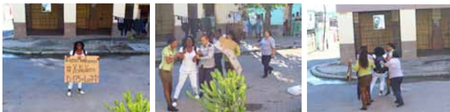
Berta Soler Fernández

Berta Soler Fernández. Líder y Representante del Movimiento Damas de Blanco.